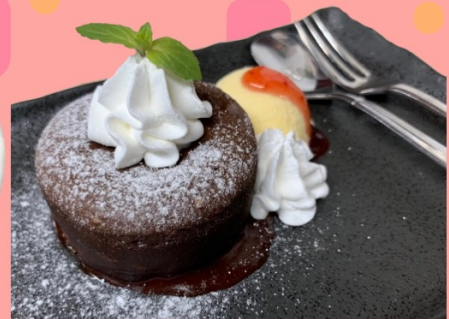
フォンダンショコラ 520円 (税込572円)