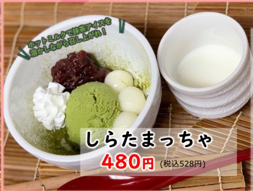
しらたまっちゃ 480円 (税込528円)