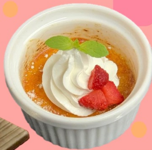
パリパリカタラーナ 480円 (税込528円)