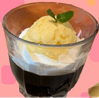
コーヒーゼリー 380円 (税込418円)