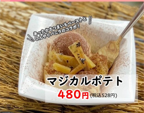
マジカルポテト 480円 (税込528円)