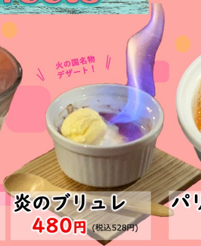
炎のブリュレ 480円 (税込528円)